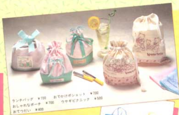
ランチバッグ ¥700 おでかけポシェット ¥700 おしゃれなポーチ ¥700 ウサギピクニック ¥500 おてつだい ¥400

みなさん、おめでとうございます。 みなさんのリクエストにより、 シルバニアファミリーの新しい グッズ「スイートパーティー シリーズ」が登場しました。自 分のお部屋や学校、 いつもあなたのそばに いさせてあげて くださいね!