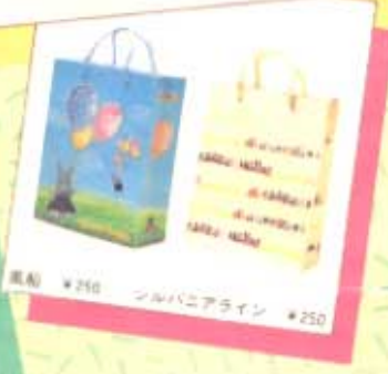
風船 ¥250 シルバニアアライン ¥250

みなさん、おめでとうございます。 みなさんのリクエストにより、 シルバニアファミリーの新しい グッズ「スイートパーティー シリーズ」が登場しました。自 分のお部屋や学校、 いつもあなたのそばに いさせてあげて くださいね!