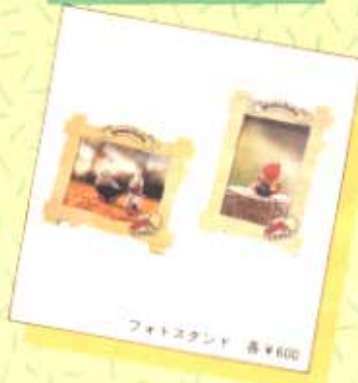
フォトスタンド 各¥600