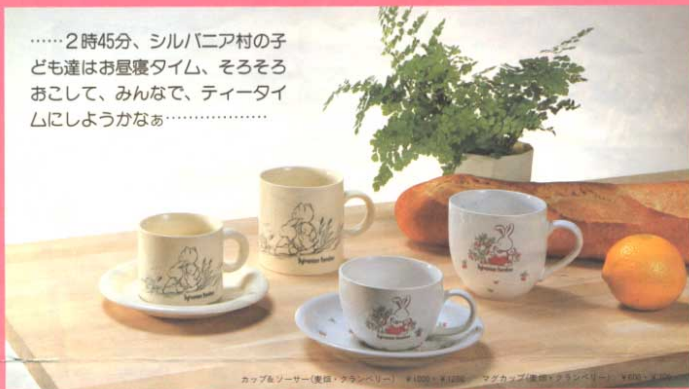
カップ&ソーサー(麦飯・クランベリー) ¥1000・¥1200 マグカップ(麦飯・クランベリー) ¥650・¥1000