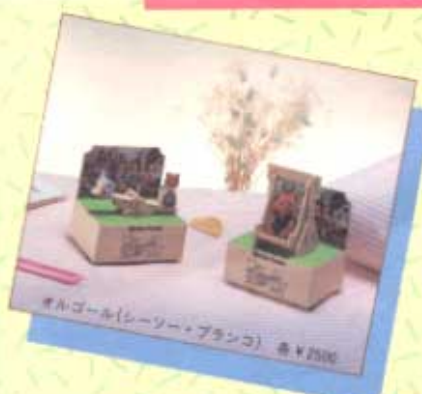
オルゴール(シーソー・ブランコ) 各¥2500