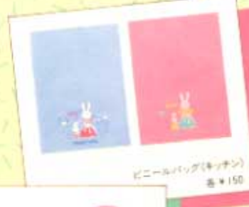
ビニールバッグ(キッチン) 各¥150