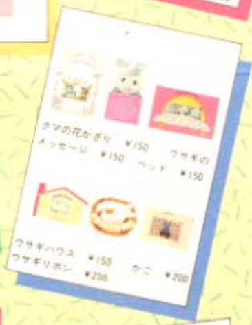
ママの花かざり ¥150 ワサギのメッセージ ¥150 ワサギのハウス ¥150 ワサギのペン ¥200 かこ ¥200