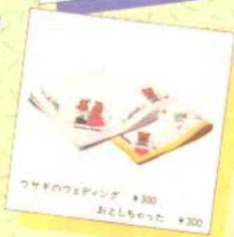
ワサギのウェディング ¥300 おとしちのった ¥300