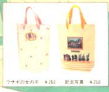
ワサギの女の子 ¥250 記念写真 ¥250