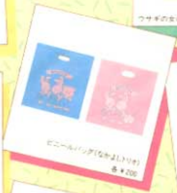
ビニールバッグ(なかよしシリーズ) 各¥200