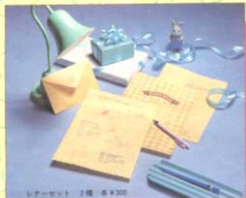
レターセット 2種 各¥300