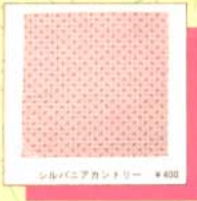
シルバニアカントリー ¥400