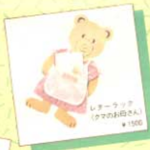
レターラップ (ママのお母さん) ¥1500