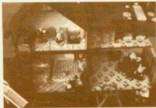
No407061 寺上 美穂