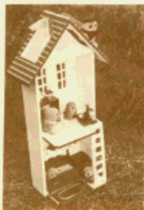
No207084 谷水 希和