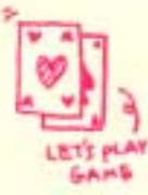
LET'S PLAY GAMES