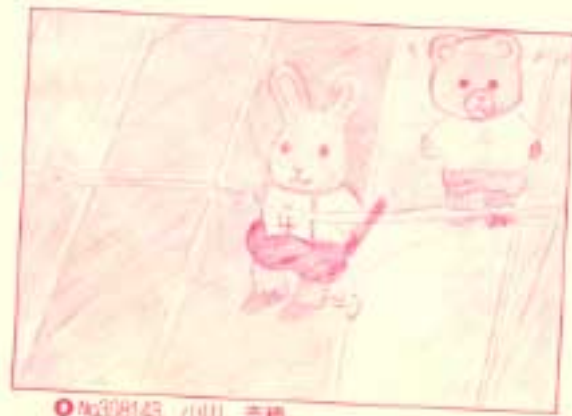
●No.38143 小川 奈穂