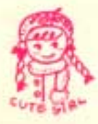
●No.708182 児玉 彩空