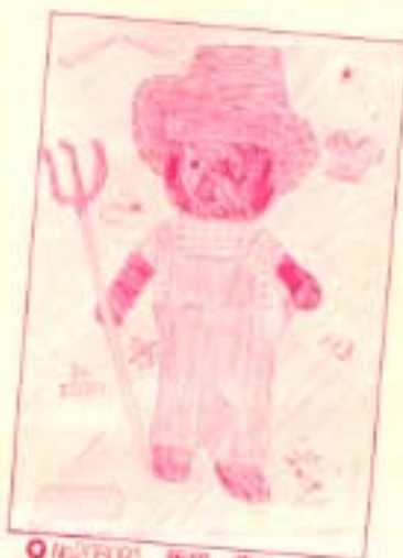
●No.280071 飯塚 貴子