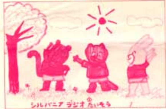
シルバニアラジオたいそう